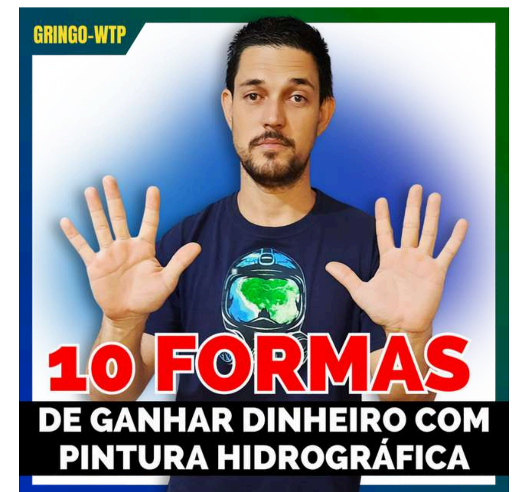
10 FORMAS DE GANHAR DINHEIRO COM PINTURA HIDROGRÁFICA