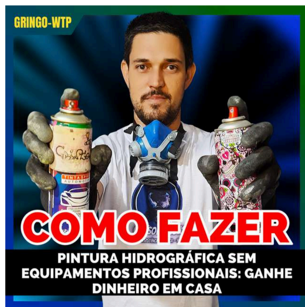
COMO FAZER PINTURA HIDROGRÁFICA SEM EQUIPAMENTOS DE PINTURA