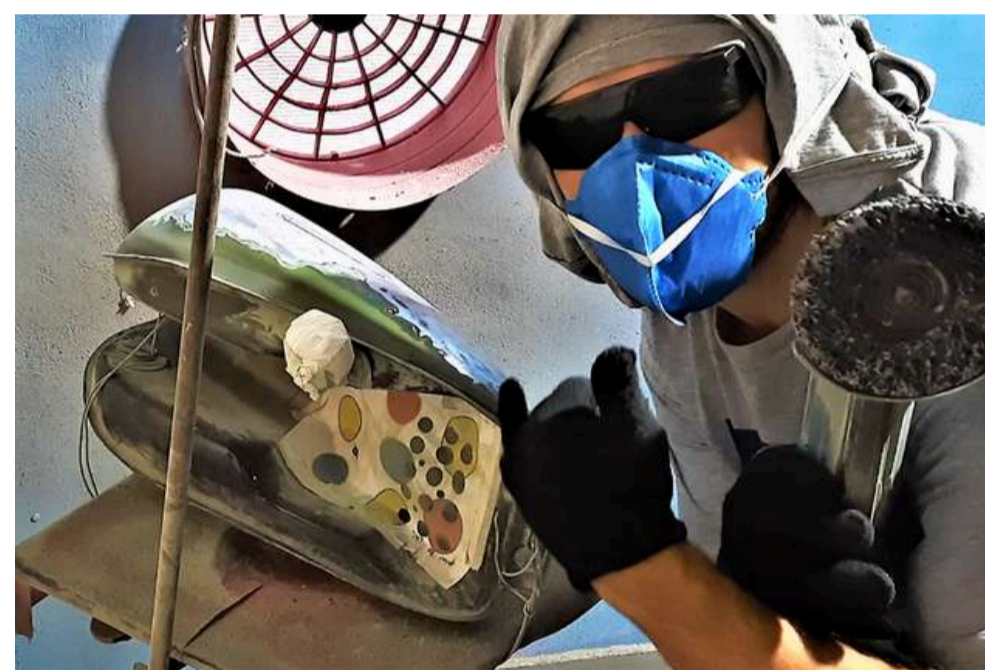
IMPORTÂNCIA DOS EQUIPAMENTOS DE PROTEÇÃO NO AMBIENTE DE PINTURA HIDROGRÁFICA