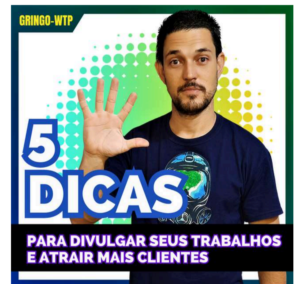
5 DICAS PARA DIVULGAR SEUS TRABALHOS E ATRAIR MAIS CLIENTES