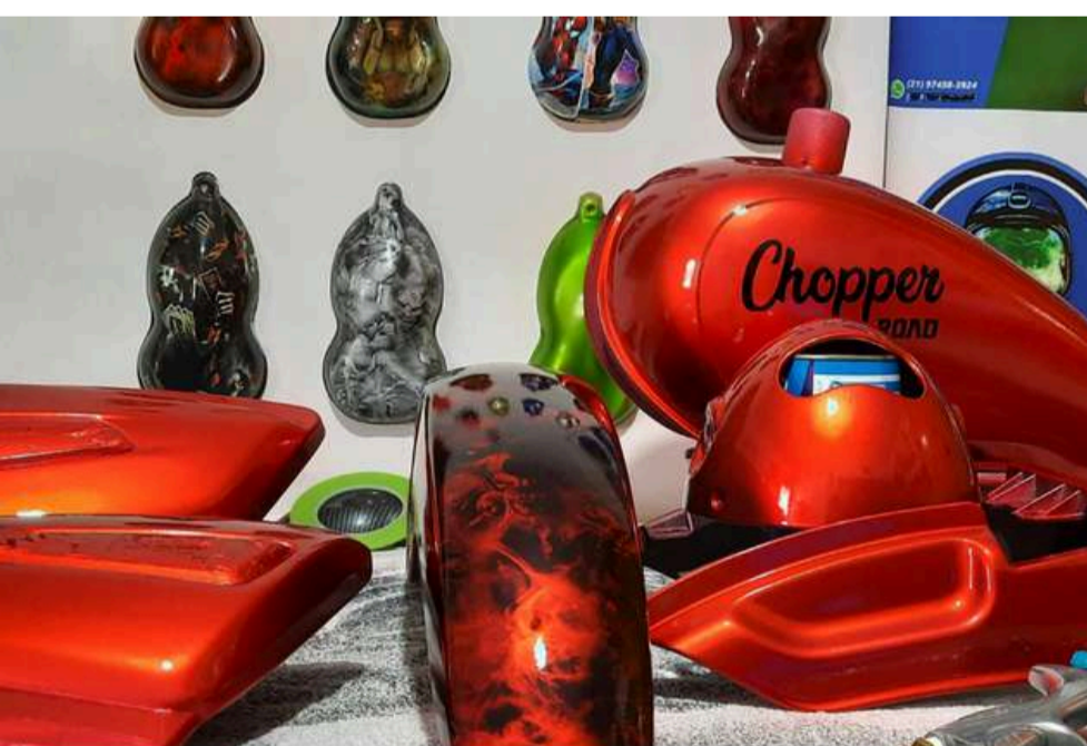
COMO FAZER PINTURA HIDROGRÁFICA EM MOTOCICLETAS