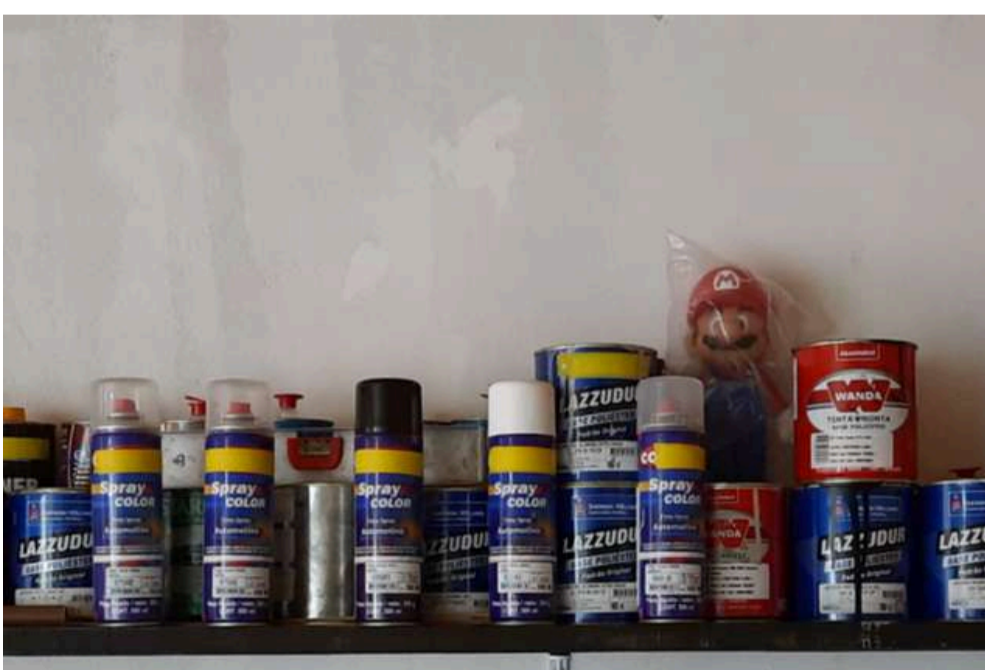
COMO ECONOMIZAR DINHEIRO NA HORA DE COMPRAR MATERIAIS PARA WTP